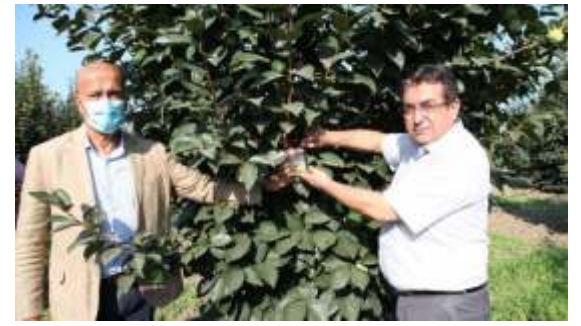
Sineği ve 2 bin adet Kanadı Noktalı Sirke Sineği tuzaklarının üreticilere dağıtılması ve bahçede tuzakların uygulamalı olarak asılmasının gösterimi ile sona erdi.