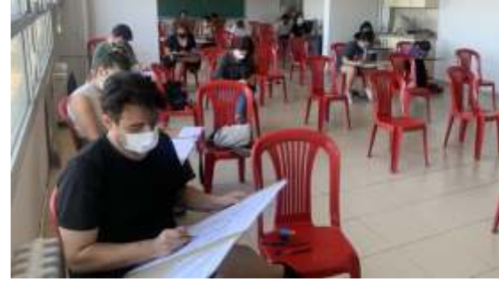
Çanakkale Onsekiz Mart Üniversitesi Güzel Sanatlar Fakültesi Yetenek Sınavları 2021-2022 Öğretim yılı yetenek

sınavları için bine yakın ön kayıt yaptırdı. Güzel Sanatlar Fakültesi bünyesinde bulunan plastik sanatlar alanına ilişkin bölümlerin ve tiyatro bölümünün sınavı eş zamanlı olarak gerçekleştirildi. Plastik sanatlar alanındaki her bölümün kendi öğretim üyelerinden oluşan jüriye, disiplinlerinin gerektirdiği ölçmeyi amaçlayan bir soruyla, farklı saatlerde sınav yaptı ve değerlendirdi. Tiyatro bölümünün sınavı ise adayların sahne, ses, dans ve hareket gibi performanslarını ölçmek için hazırlanan iki aşamada yapıldı. 2021-2022 Öğretim yılı için öğrenci alma kontenjanı, Resim Bölümü 30, Seramik ve Cam Bölümü 30, Tekstil Tasarımı Bölümü 20, Geleneksel Türk Sanatları Bölümü 25, Grafik Tasarımı Bölümü 40, Tiyatro Bölümü 20 olarak belirlendiği açıklandı.